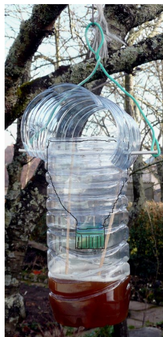
Le plus perfectionné.