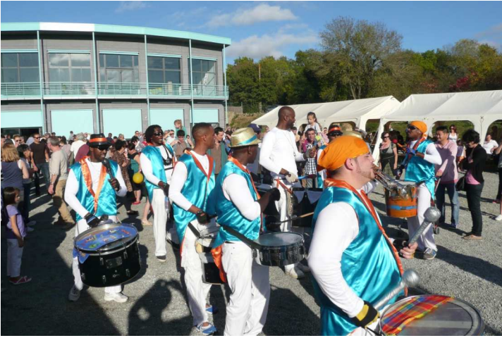
La fête des châtaignes

Le week-end des 18 et 19 octobre 2014, la SAEL à organisé ses deux événements traditionnels : le vide greniers et la fête des châtaignes. Ces deux moments de convivialité ont permis aux anciens et nouveaux herblinois de se rencontrer.