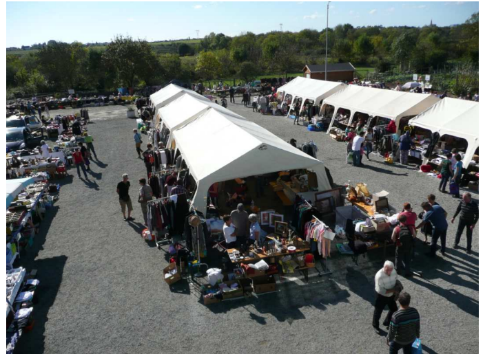
Le vide greniers