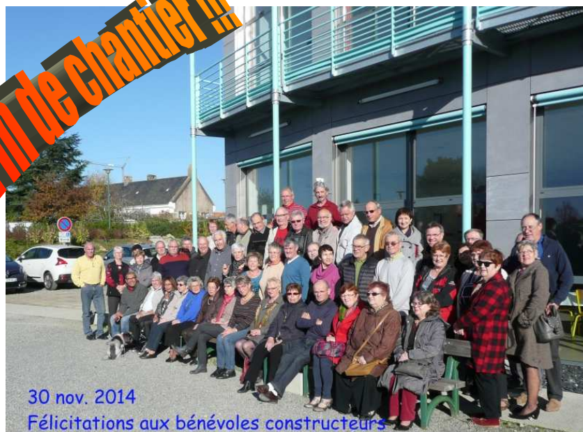
30 nov. 2014 Félicitations aux bénévoles constructeurs